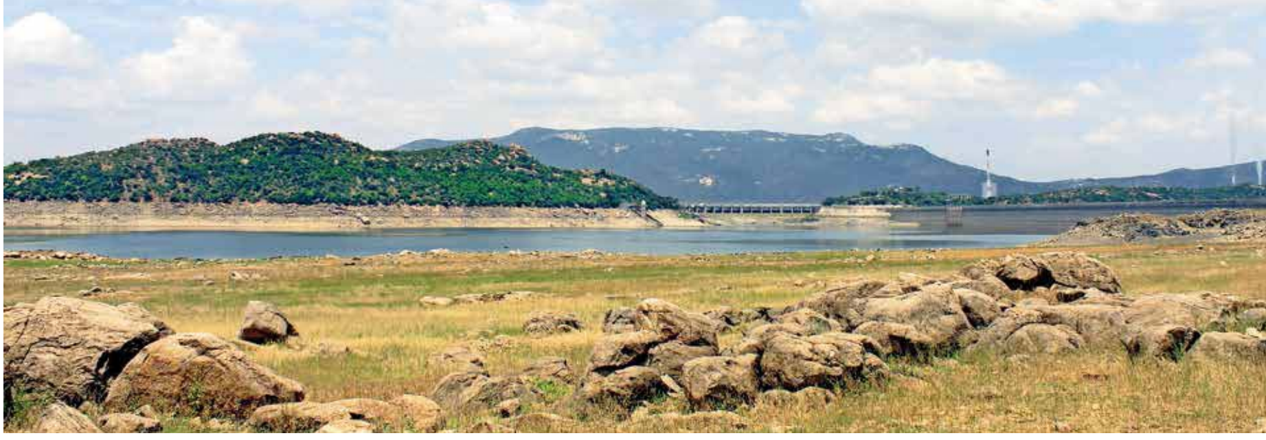
▶ காவிரி ஒப்பந்தப்படி தமிழகத்துக்கு தேவையான தண்ணீரை கர்நாடக அரசு தருவதில்லை. பருவ மழையும் முழுமையாக பெய்யவில்லை. இதனால், மேட்டூர் நீர்மட்டம் 22 அடியாக சரிந்து, ஆங்காங்கே பாறைகளாக காட்சி அளிக்கிறது.